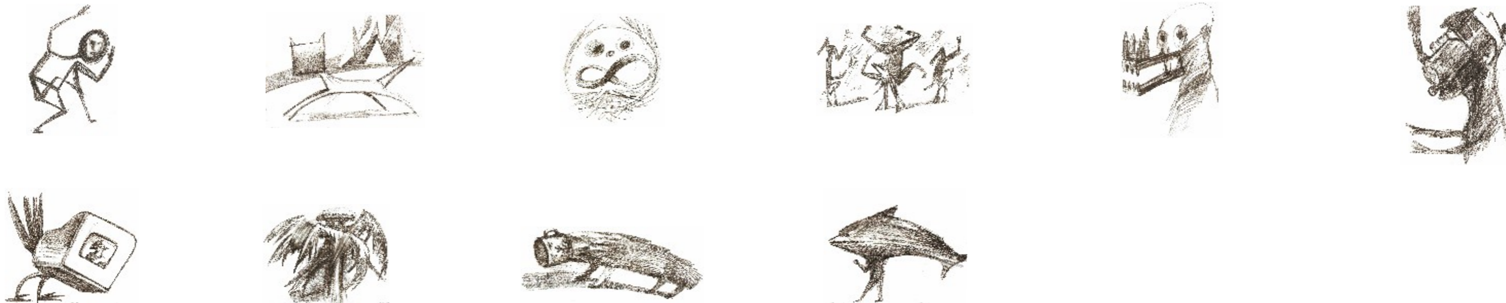
Josef Daněk, Genetické poruchy, 2014, tužka, papír 21x29,7 cm