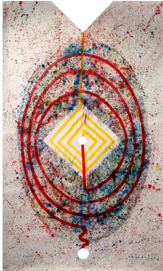
Ivo Sedláček, Dvojí řád, 2014, akryl, papír, perforce, 270x150 cm