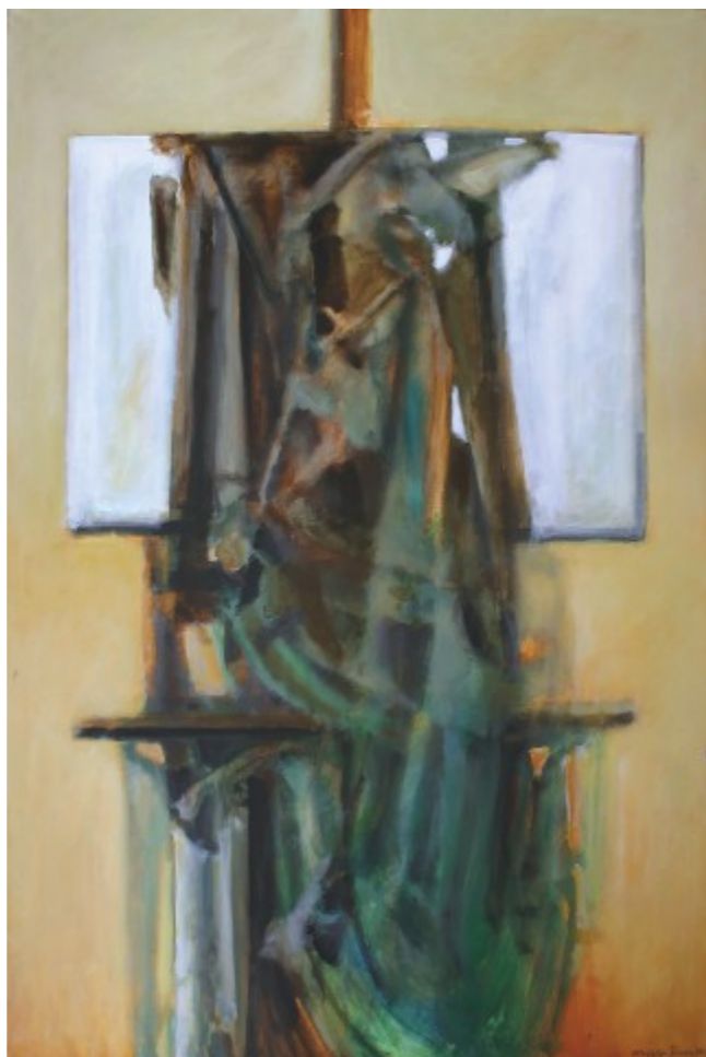
Malířova stěla, 2015, akryl, plátno, 150x100 cm