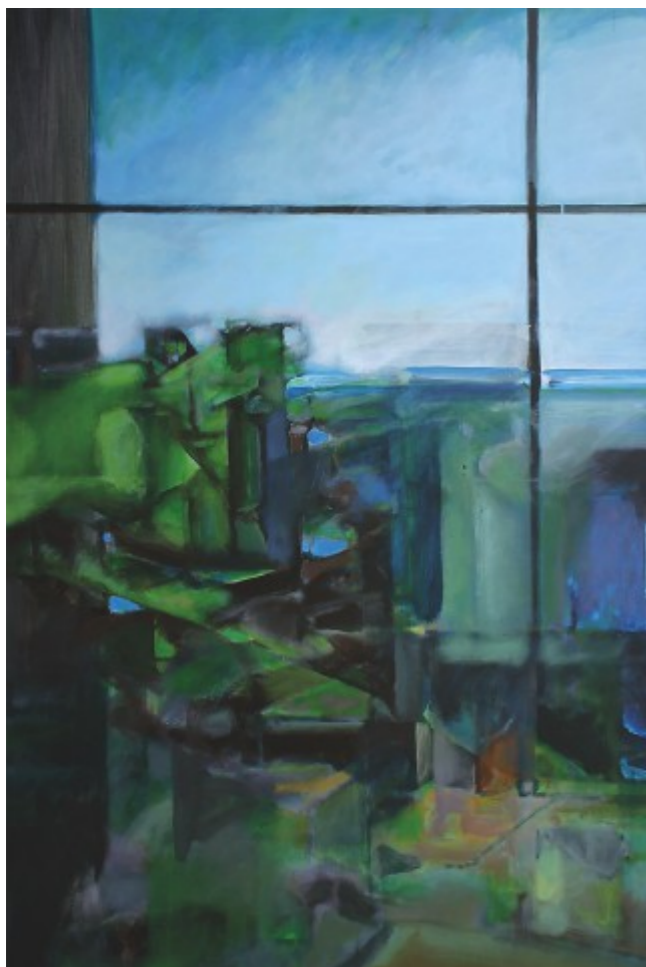
Ateliér, 2013, akryl, plátno, 150x100 cm