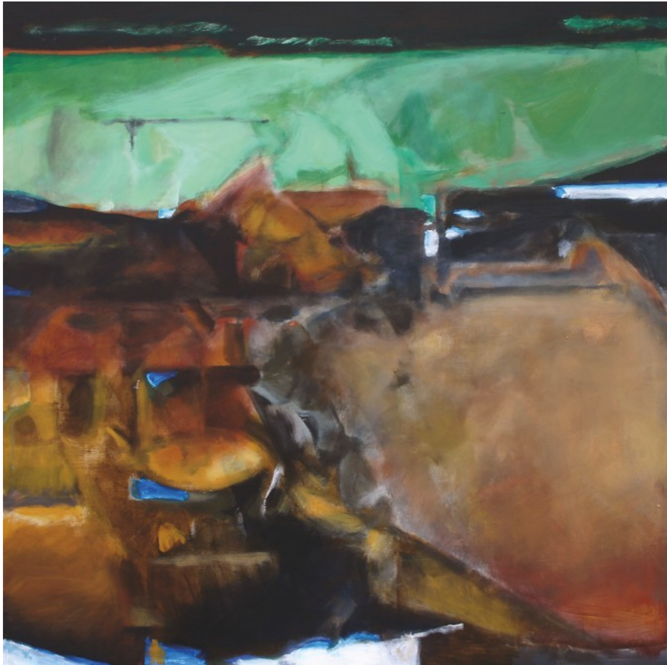
Dávná krajina, 2013, akryl, plátno, 100x100 cm