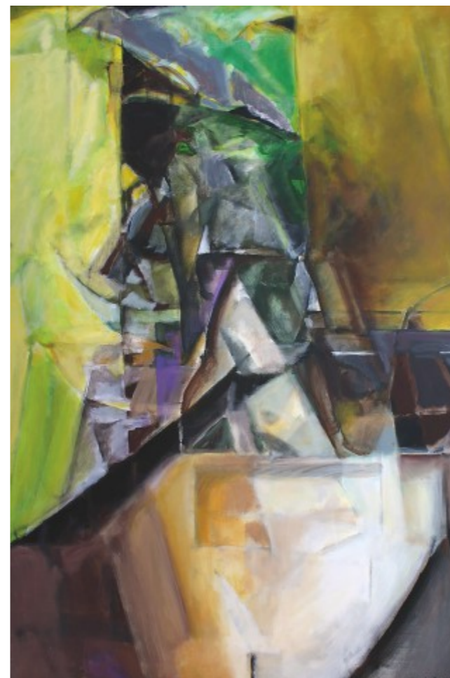
Velké zátiší, 2013, akryl, plátno, 150x100 cm